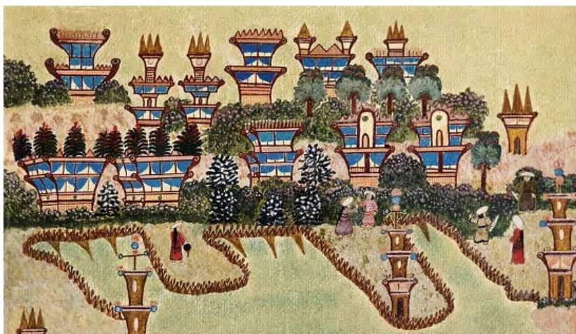
Figura 2. «Casa de Astané» en The Martyan Cycle , 1896 [6].

ducciones automáticas se podían explicar por criptomnesia, es decir, por el resurgimiento de recuerdos olvidados, contradiciendo así la creencia de la propia médium.