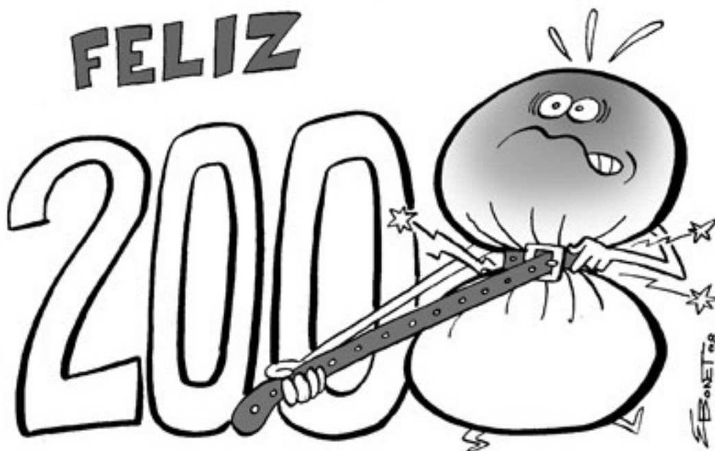
Viñeta de E. Bonet publicada en La Opinión de Granada (2008)

En este último, en el que publicará junto a A. Soria la citada sección “La corriente alterna”, ha desarrollado no sólo una intensa labor caracterizada por unos dibujos cuidados, aunque para nada barrocos, y un humor fino, elegante, en algunos casos ligeramente irreverente, pero siempre calculado, buscando la sonrisa y la reflexión sobre el tema tratado, sino que también ha puesto en práctica su maestría para la caricatura y su buen hacer como ilustrador, actividad de la que ha dejado muestras en libros editados por Comares ( Los cuentos de la Alhambra para niños ) o Edebé ( El héroe del castillo negro, El niño que mató a Dios ).