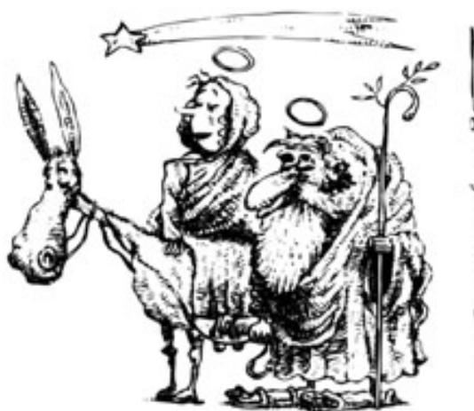
Viñeta de Mesamadero publicada en Ideal (1995)

El niño está a punto de nacer. Será inmediatamente después de la publicidad.