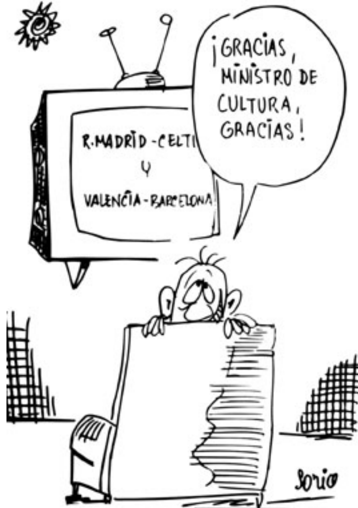
Viñeta de Soria publicada en Patria (1980)

Si bien no ha creado a lo largo de su dilatada carrera como dibujante ningún personaje fijo, sus viñetas son reconocibles para todos no sólo por su particular gracia y por su dibujo rápido, sino también por la omnipresencia de su “sol”, más que el astro rey, una «rueda de churros con ocho puntas» [44]