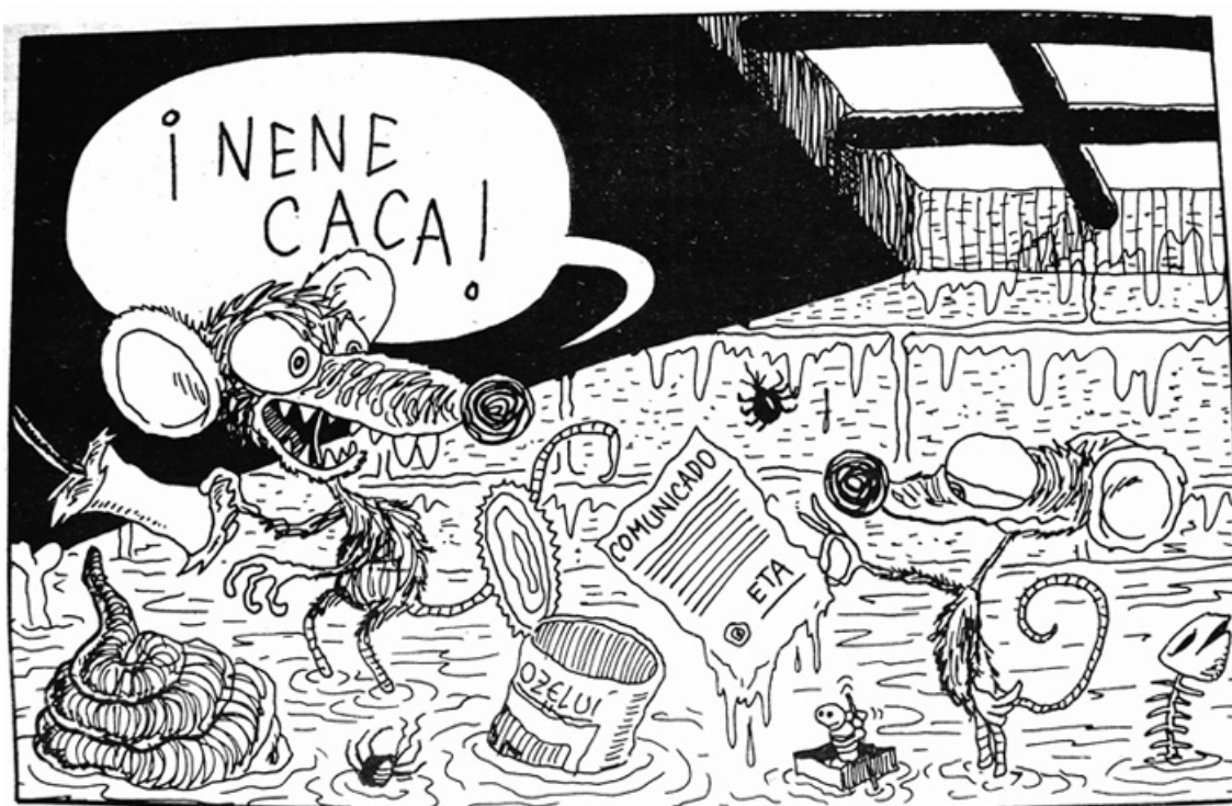
Viñeta de Ozelú publicada en Día de Granada (1986)

El cansancio y nerviosismo que le provocaba el tener que crear día tras día una nota gráfica de actualidad, junto a la citada demanda de viñetas e historietas que desde El Jueves recibía, le llevó a abandonar esta creación diaria, actividad en la que siempre se distinguió por su fino humor y el alejamiento de la viñeta hiriente.