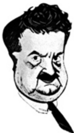
Autocartoon de Tovar publicada en Reflejos (1925)

importancia reconocida en diversos homenajes tanto por sus contemporáneos madrileños [11], como por el mundo de la cultura nacional y granadino [12].