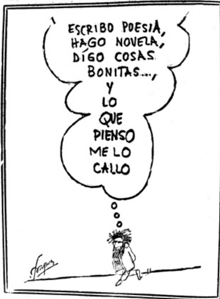
Viñeta de Frapuci publicada en Patria (1972)

Dibujante de trazo rápido, con cuyas caricaturas no busca la carcajada, «sino simple y llanamente la sonrisa» [51], sus primeros pasos en el mundo del humor gráfico los daría en Melilla, durante el servicio militar. Vuelto a Granada comenzó a colaborar en algunas publicaciones locales. Así vamos a encontrar su firma en Ideal , La Hoja del Lunes , Patria , diariamente en 1972, Granada Semanal , El Defensor de Granada . Segunda época, Granada en Corpus y Semanal Informativo de Granada , en el que aparecerían casi todos los “tipos” que crease a lo largo de los años: “El Quieto”, “Corazoncito”, “El Pasota” o el