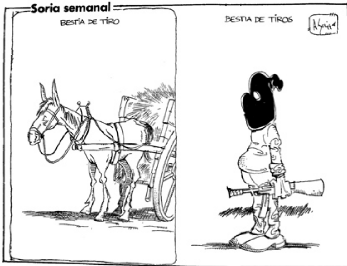
Viñeta de A. Soria publicada en Diario de Granada (1983)

Se autodefinirá como «hiperrealista», lo que le llevará a considerar más fácil el dibujo que el pie; así para él esta labor en el diario será la de «expresar la conciencia de clase», utilizando el humor «como vehículo hacia la crítica» [61]; esta posición, junto a su predilección por los temas de actualidad nacional e internacional le han llevado a trabajar para la Agencia Zardoya y, actualmente, para la agencia londinense Cartoons Stock.